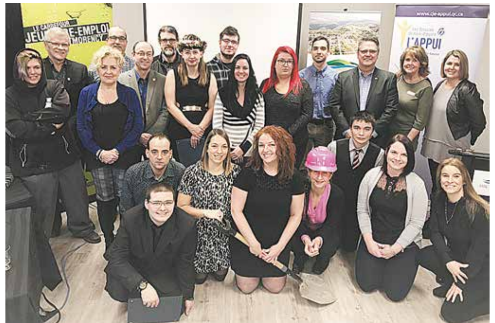
Les participants, les intervenants, les municipalités adhérentes et les partenaires financiers du Chantier urbain Côte-de-Beaupré s'étaient donné rendez-vous dans la salle du conseil de la MRC de la Côte-de-Beaupré.

de-Beaupré; produire des accessoires et du mobilier de bois en atelier d'ébénisterie et de soudure; et participer à des activités de formation portant sur diverses thématiques. ●