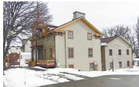
Disposant de plus de 5000 pieds carrés d'espaces à bureaux et de 22 espaces de stationnement, les anciens locaux de Génécor au 660, avenue Royale, face à la Banque Nationale, sont maintenant à louer. D'allure typiquement victorienne, cette maison patrimoniale du Vieux-Beauport a appartenu au notaire O'Brien dans les années 1850 avant de passer à la famille Mailloux de 1900 à 1940 et à la famille Rainville de 1941 à 1988.