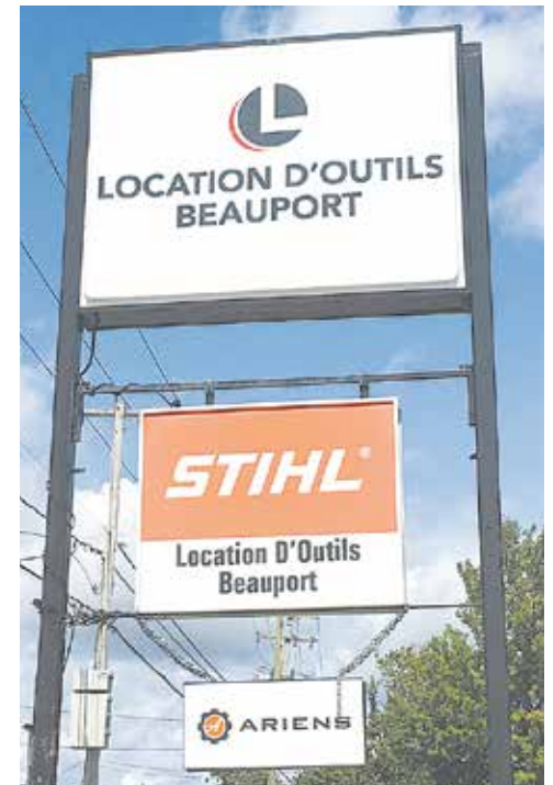
Location d'outils Beauport compte deux points de service, au 312, rue Seigneuriale, à Beauport (photo) et à Charlesbourg au 20660, boulevard Henri-Bourassa, sortie Bernier, face au magasin Canac.