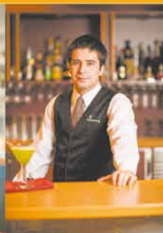
Service de la restauration