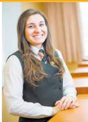
Réception en hôtellerie